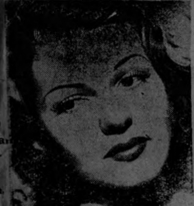
BITA HAYWORTH, Estrella de Columbia

Si quiere Vd. lucir más bella y seductora, pruébe el Maquillaje en Armonía de Colores Max Factor Hollywood, que es el que usan las famosas estrellas. ¡Y verá Vd. lo sí mucho que realiza su tipo individual!